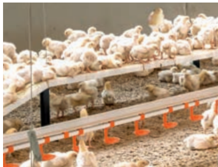
Podwyższona platforma – Kod Nr 15-22-5086