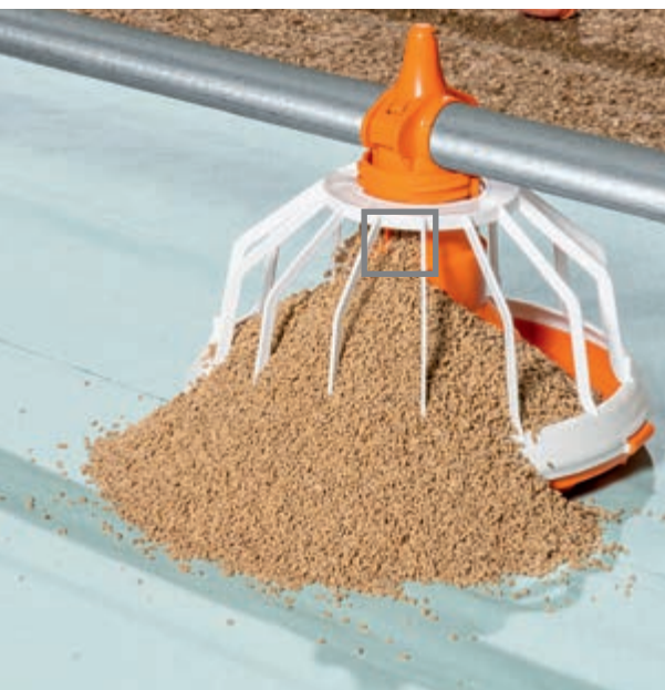
Pasza wysypuje się tylko wtedy, gdy karmidło stoi na podłodze