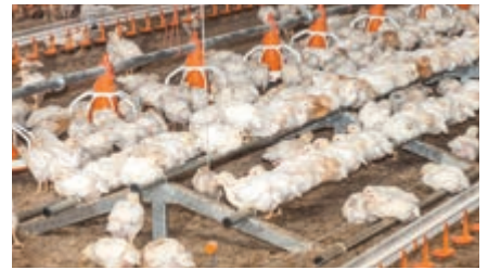
A-Reuter 5800 – Kod Nr 83-13-8698

bardzo łatwo. Standardowo platforma ma wymiar 3448 x 750 mm = 0,878 m 2 . Kosze, które są wypełnione słomą lub sianem, są bardzo dobrze odbierane przez ptaki. Można je łatwo zawieszać do sufitu i usuwać przy opróżnianiu kurnika. Dokładne informacje o tych i innych produktach znajdują Państwo w osobnej ulotce.