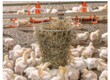
Kosz na słomę lub siano – Kod Nr 65-97-3530