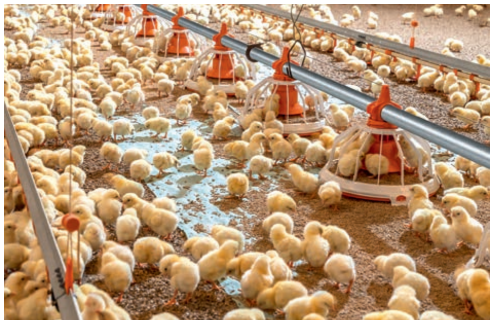
Jednodniowe pisklęta znajdują natychmiast paszę i są zachęcane, aby jeść z karmidła