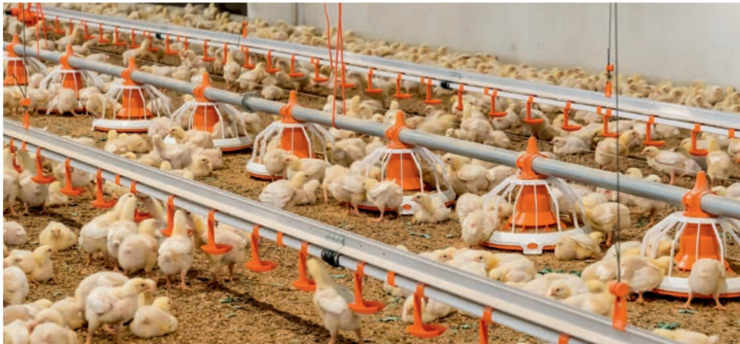
FLUXX 330 z płytką misą z kieszeniami, w pozycji z wysokim wysypem paszy

Takie karmidło stanowi wybór dla każdego, kto zawodowo zajmuje się tuczem brojlerów.