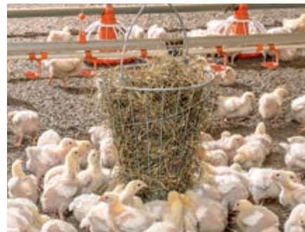
Кош със сено и слама – Код № 65-97-3530