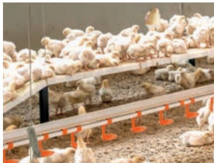
Платформа – Код № 15-22-5086

улеснен, тъй като тя е повдигната само на 330 мм от пода. Стандартните размери на платформата са 3448 x 750 мм = 0,878 м 2 . Птиците приемат много добре кошовите, пълни със сено и слама. Те се окачват да висят от тавана и при нужда много лесно могат да се премахнат. Повече информация за тези и други наши продукти можете да получите от други наши проспекти.