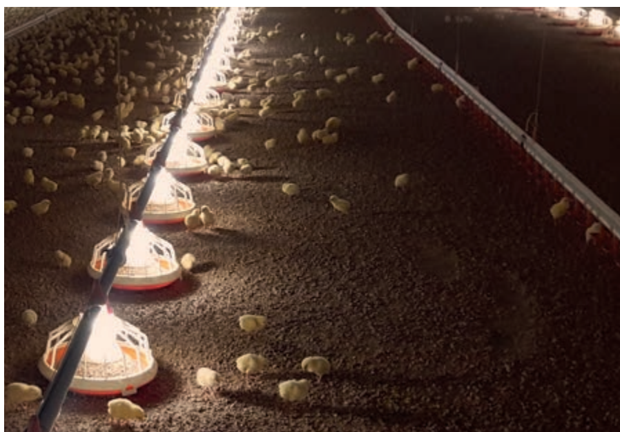
FlexLED glo при хранилка FLUXX 330

При FlexLED glo става дума за много малка LED-лампа, която е интегрирана в средния цилиндър на хранилката. Тя улеснява бройлерите по-лесно да стигнат до фуража. Особено през първите дни малките пиленца намират храната още по-лесно. По този начин се оптимизира началния период от угодяването на пилетата. Освен това се създава добра възможност да се откажем от ръчното подаване на фураж върху хартия.