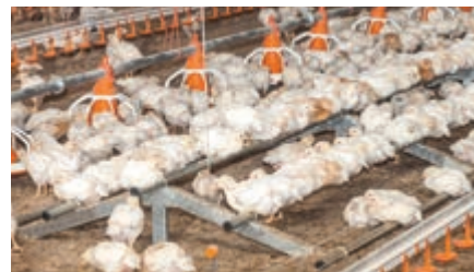
A-Reuter 5800 – Код № 83-13-8698