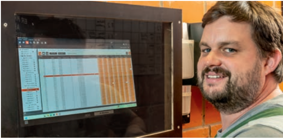
BigFarmNet демонстрирует фермеру все важные показатели