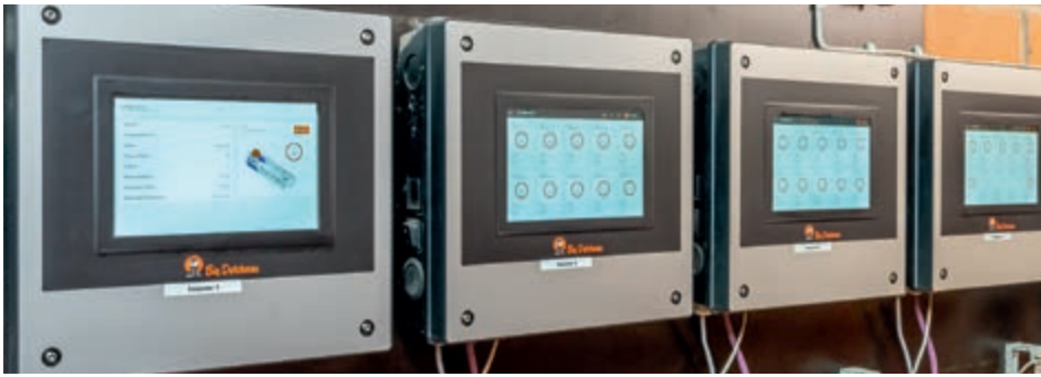
До 10 станций CallBackpro могут просматриваться на большом дисплее