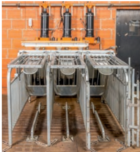
Скоба против лежки не позволяет свиноматке оставаться на станции дольше необходимого