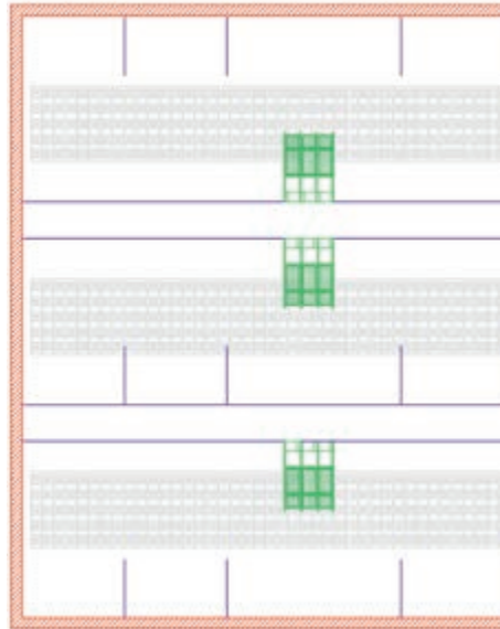
Простое переоснащение станков индивидуального содержания в зоне ожидания на станцию CallBackpro

Стационарный компьютер 510pro оборудован большим, 10-дюймовым сенсорным экраном, обеспечивающим отличный обзор. На экране отображается важная информация, например, сведения о свиноматках, которые еще не поели, о количестве потребленного корма и об аварийных сигналах. Еще одно преимущество заключается в том, что стационарный компьютер не должен находиться рядом с CallBackpro, а может быть установлен в проходе. Это обеспечивает лучший доступ.