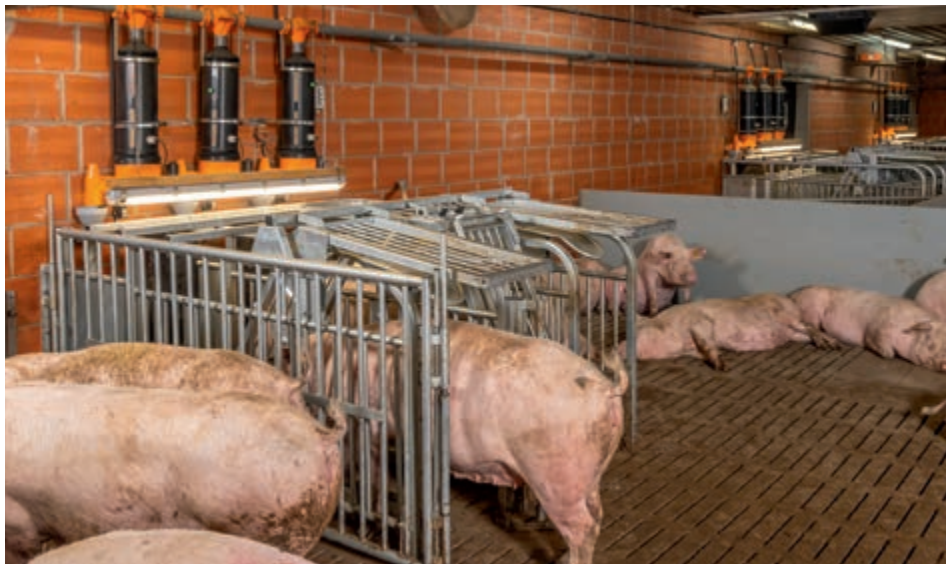
Индивидуальное кормление каждой особи в защищенной зоне

ние становится возможным. Размер группы масштабируется с шагом по 20 голов. Необходимо лишь изменить число кормомест. Если у свиноматок уже есть опыт использования индивидуального станка с самофиксирующейся дверцей, обучение будет чрезвычайно простым.