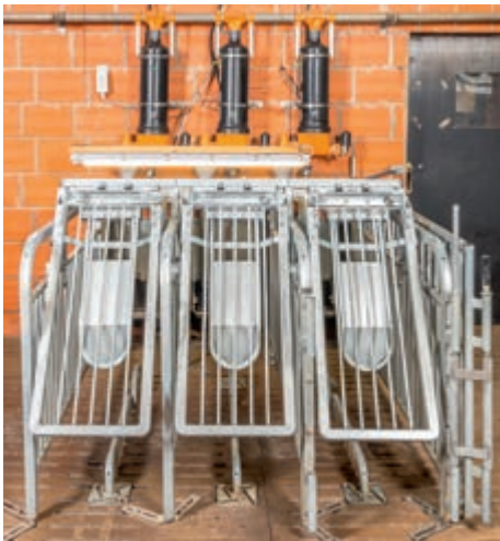
Наша рекомендация: три станции для 60 свиноматок на бокс