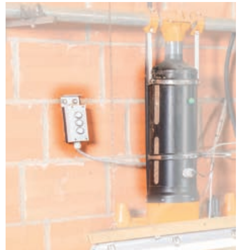
Дозирование корма вручную (опция); кормовая емкость оборудована смотровым окошком для контроля уровня заполнения кормом