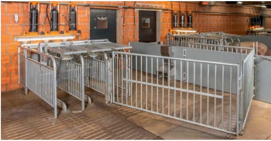
Отдельный интеграционный бокс для свиноматок, позволяющий им легко приобщиться к существующей группе свиноматок; может также использоваться в качестве бокса для больных свиноматок