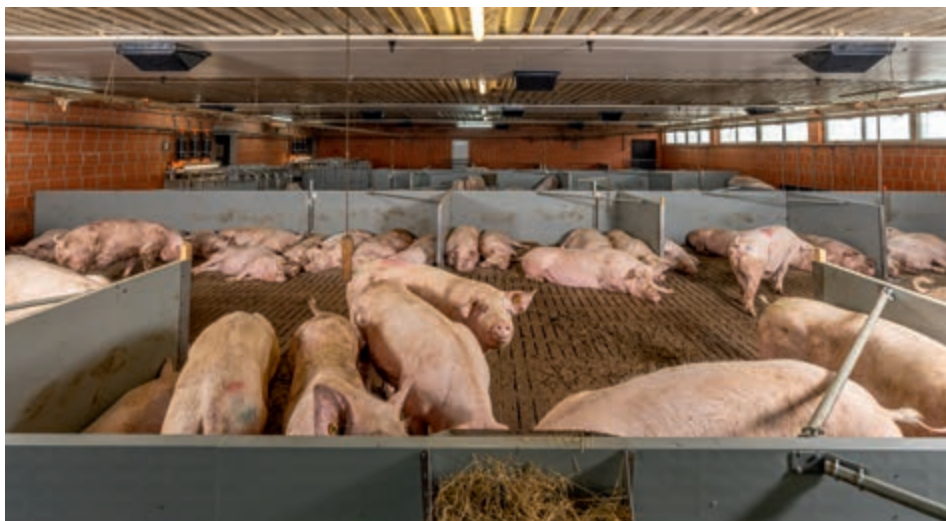
Просторная зона для активностей и отдыха обеспечивает хорошее самочувствие и достаточно возможностей для движения