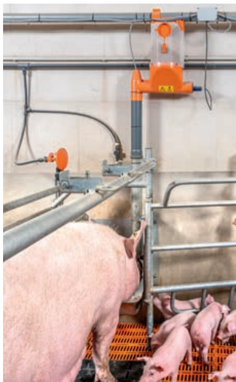
Станок опороса ActiWel с системой BigFarmNet-Manager

В данном случае время кормления и количество поедаемого корма устанавливаются системой BigFarmNet-Manager заранее. Необходимость в датчике отпадает.