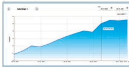
Dzienna średnia masa ciała grupy zwierząt