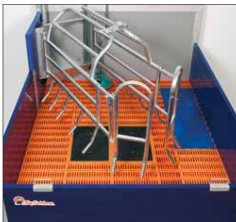
Kojec porodowy z systemem podłogowym, przyjaznym dla zwierząt

Komputer stacji żywieniowej można zamontować także w korytarzu. Gwarantuje to lepszą dostępność (strefa wolna od zwierząt), tak że można wprowadzić potrzebne ustawienia do komputera.