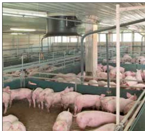
Karmienie na mokro z systemem HydroMix oraz BigFarmNet

H ydroMix – komputerowo sterowane żywienie na mokro jest idealnym systemem do w pełni zautomatyzowanego karmienia tuczników. Niezmiernie niezawodna i dopracowana technologia służy do w pełni zautomatyzowanego przygotowywania receptur z pojedynczych komponentów. Oprócz wysokiej dokładności dozowania z każdego zaworu żywieniowego dalszą zaletą systemu jest jego duża elastyczność. Dzięki temu nasza firma opracuje dla każdego klienta pasującą koncepcję instalacji.