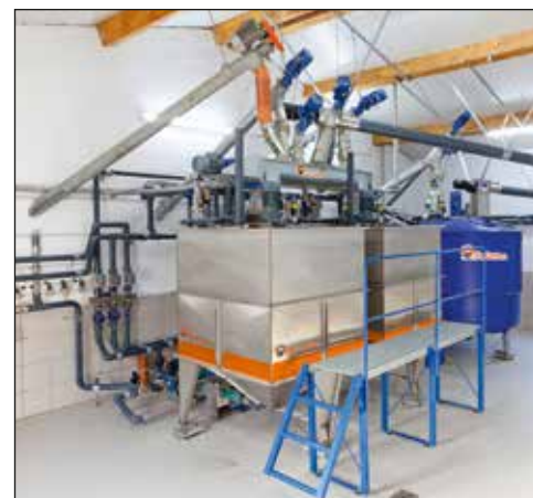
HydroMix – sterowany komputerowo system karmienia na mokro

System karmienia na mokro HydroMix firmy Big Dutchman jest odpowiednim systemem dla stosowania tanich komponentów paszowych.