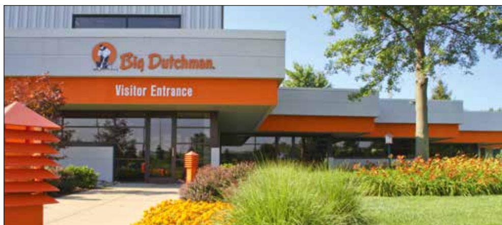
Big Dutchman, Inc. – centrala firmy w Stanach Zjednoczonych

Ponad 2000 pracowników pracuje w firmie Big Dutchman, w tym około 250 techników, troszczących się o dalszy rozwój i ulepszanie sprzętu i programów naszej firmy. Szeroka oferta handlowa, doświadczeni przedstawiciele i ciągle polepszany Know-How są podstawą sukcesu firmy Big Dutchman.