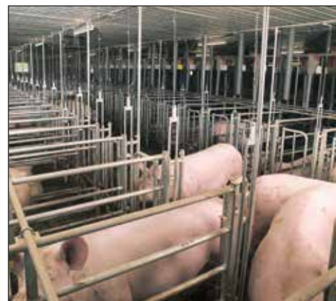
Kojce indywidualny samozamykający "Easy Lock"

W sektorze loch prośnych utrzymanie grupowe loch w ciąży zyskuje cały czas na znaczeniu. Kojce indywidualne samozamykające umożliwiają samodzielne wchodzenie i opuszczanie kojców przez lochy.