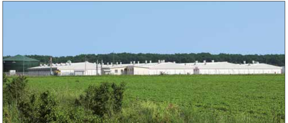
Kompleks farm Andrijaševci 1, Chorwacja z 1500 miejscami, hodowla loch

N iezależnie od tego, czy w południowych Chinach czy na Syberii – firma Big Dutchman proponuje odpowiednie rozwiązanie każdego problemu. Obojętnie, czy na fermie hodowanych jest sto, tysięcy lub pięćdziesiąt tysięcy zwierząt. Życzenia naszych klientów są uwzględniane przy sporządzaniu nowoczesnych, pewnie funkcjonujących systemów utrzymania i zadawania paszy.