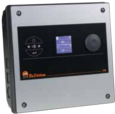
135pro – steruje klimatem w chlewni