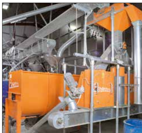
Kuchnia paszowa z młynem, mieszalnik i HydroMix

D o szerokiej oferty handlowej firmy Big Dutchman należą także urządzenia mielące i mieszające. Wśród hodowców coraz częściej spotykane jest wytwarzanie mieszanki paszowej z własnego zboża. Dzięki takim systemom można sporządzić indywidualną mieszankę, jakość paszy jest znana. Dodatkowo można zaoszczędzić koszty transportu. Obniżanie emisji z budynków inwentarskich będzie w przyszłości zyskiwało na znaczeniu. Firma Big Dutchman oferuje swoim klientom system MagixX-P z wysoko skutecznym oczyszczaczem powietrza.