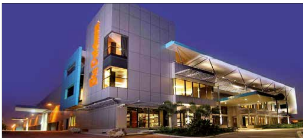
Big Dutchman Asia – centrala firmy w Malezji

Nazwa Big Dutchman jest na całym świecie symbolem jakości, niezawodności oraz sukcesów ekonomicznych. Innowacyjna technologia, konsekwentny rozwój instalacji dostosowanych do rynku oraz rozwiązania "krojone na miarę" należą do skutecznych strategii firmy. Spółki córki oraz agencje, znajdujące się w wielu krajach, gwarantują bliskość do rynku oraz niezawodnie działającą sieć serwisową.