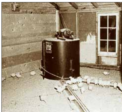
Automatyczny paszociąg od 1938 roku

Firma Big Dutchman zawdzięcza swoje imię dwóm holenderskim braciom, którzy w 1938 roku w Stanach Zjednoczonych skonstruowali pierwszy automatyczny system zadawania paszy dla drobiu. Dzięki niemu zasadniczo polepszyła się wydajność produkcji jaj i mięsa drobiowego.