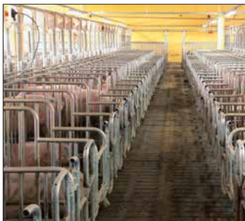
Centrum krycia z oddzielnym kojcem knura

Nasza oferta handlowa jest stale uzupełniana odpowiednimi systemami wentylującymi, ogrzewania, chłodzenia oraz oczyszczania powietrza. Celem jest stworzenie optymalnych warunków klimatycznych w każdej chlewni naszych klientów.