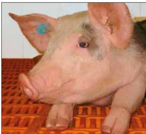
Nowoczesne urządzenia inwentarskie oraz systemy zadawania paszy są podstawą

Skuteczna hodowla loch wymaga zarówno wysokiej fachowości jak i odpowiednich technicznych rozwiązań. Firma Big Dutchman oferuje Państwu nowoczesne urządzenia inwentarskie oraz systemy paszowe, które są podstawą sukcesu ekonomicznego.