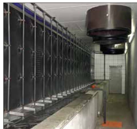
MagixX-P – efektywny system oczyszczania powietrza

BigFarmNet jest nowoskonstruowanym systemem sterowania i zarządzania całą fermą hodowli trzody chlewnej. Oprogramowanie jest łatwe w obsłudze i takie samo we wszystkich wersjach, niezależnie od tego czy obsługuje produkcję, wentylację czy analizę danych. Krótko mówiąc oznacza to, iż są Państwo w stanie sterować systemem karmienia na mokro czy wentylacją oraz dokonywać analizę ekonomiczną danych przy pomocy jednego programu.