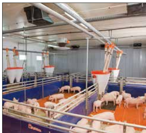
Automaty paszowe PigNic-Jumbo w odchowcie prosiąt

W nowoczesnym odchowcie prosiąt i tuczu systemy odchowu, technologia zadawania paszy oraz regulacja klimatu odgrywają decydującą rolę w odniesieniu sukcesu przez hodowcę. Oferując systemy dojrzałe technicznie firma Big Dutchman stwarza warunki do nowoczesnego i skutecznego chowu trzody chlewnej. Niezależnie od tego, czy będą Państwo budować nową chlewnię, przebudowywać lub odnawiać istniejące budynki, nasi doradcy są do Państwa dyspozycji.