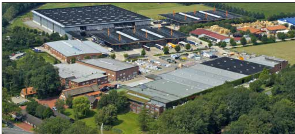
Big Dutchman International GmbH – centrala firmy w Niemczech

Dzisiaj firma Big Dutchman jest międzynarodowym koncernem, który dostarcza wyposażenie chlewni i kurników do więcej niż 100 krajów. Centrala firmy dla Europy Wschodniej i Zachodniej oraz Środkowego Wschodu znajduje się w Vechcie (Niemcy); dla Azji w Kuala Lumpur (Malezja); dla Ameryki Północnej w Michigan (Stany Zjednoczone).