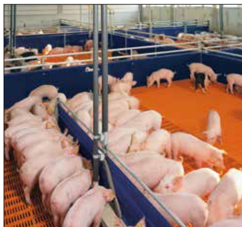
System karmienia na mokro zastosowany w odchowni prosiąt

W odchowniach prosiąt firma Big Dutchman oferuje Państwu łatwe w montażu oraz czyszczeniu systemy odchowu. Wyposażone one są w bezpieczną podłogę z rusztów plastikowych, która chroni zwierzęta przed obrażeniami. Jeżeli chcą Państwo żywić swoje warchlaki paszą płynną, nasz system zadawania paszy na mokro HydroAir z korytami sensorowymi jest systemem odpowiednim. Można wymieszać małe ilości komponentów. Pasza dostarczana do zwierząt jest zawsze świeża.