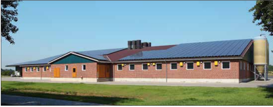
Zakład tuczu świń z 1800 miejscami tuczowymi

O d mieszalni pasz do tucznika, gotowego do rzeźni – firma Big Dutchman dostarcza do swoich klientów z całego świata wyposażenie budynków inwentarskich każdego rodzaju. Długoletnie doświadczenie i techniczna wiedza dbają o to, aby nasze instalacje funkcjonowały wyśmienicie w każdym klimacie i pod określonymi warunkami.