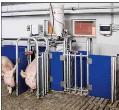
CallMaticpro – sterowane komputerowo karmienie wywoływane

C allMaticpro jest systemem żywieniowym dla loch prośnych w hodowli grupowej. Zalety hodowli zgodnie z rytmem życia loch oraz karmienie dostosowane do każdego zwierzęcia zostały połączone w sposób idealny. Indywidualne karmienie oznacza przydzielanie paszy dokładnie dostosowane do stanu lochy. Można zastosować zarówno karmienie na sucho jak i na mokro.