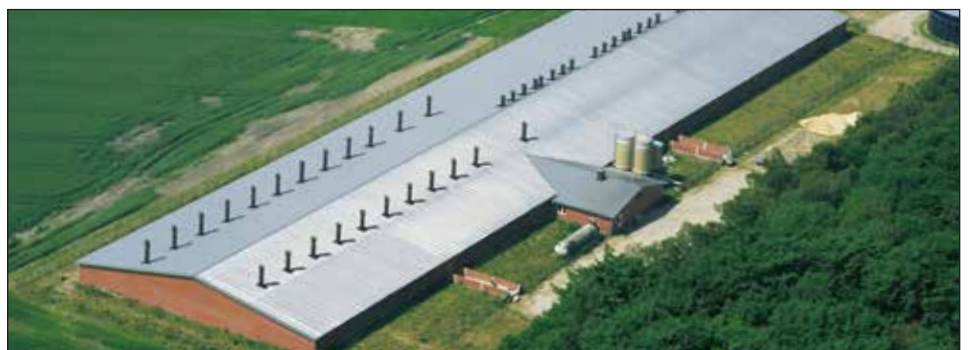
Farma Garther Heide w Niemczech z ok. 2000 miejscami, hodowla loch

N asi doświadczeni doradcy służą Państwu cały czas doradztwem. Mogą Państwo uzyskać u nich wszelakie informacje na temat naszych produktów.