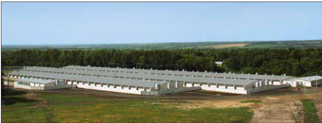
Kompleks farm Rakitianskij w miejscowości Belgorod, Rosja z 4800 miejscami, hodowla loch

P rzyszłość stawia przed nami nowe zadania, które rozwiążemy wspólnie z naszymi klientami z całego świata. Dzięki temu chcemy naszą pozycję znanego lidera w branży rozbudowywać oraz wzmacniać.