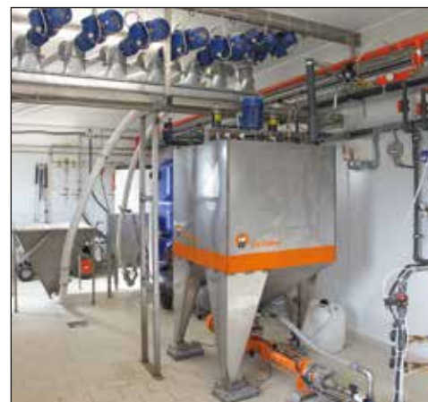
HydroAir – precyzyjny system karmienia na mokro dla warchlaków

Dla każdego hodowcy prawidłowy system karmienia odgrywa decydującą rolę. System DryRapid firmy Big Dutchman jest bardzo wydajnym systemem zadawania paszy, który można stosować w żywieniu loch, warchlaków oraz tuczników. Dzięki automatom paszowym PigNic oraz PigNic-Jumbo uzyskać można bardzo duże dzienne przyrosty.