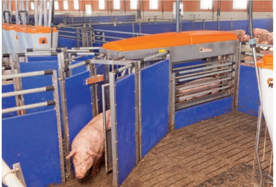
Upotreba TriSort pro sa dva seleksijska izlaza

konstantno prati. Proizvođač koristi objekt efikasnije. Zahvaljujući preciznim podacima o težini, svako područje hranjenja može biti opskrbljivano sa individualnom vrstom hrane (visoka ili niska energija). Dodatno, preteške ili prelagane svinje mogu biti označene sa dvije različite boje.