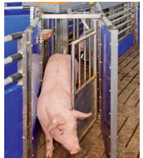
Izlaz sa seleksijskim vratima