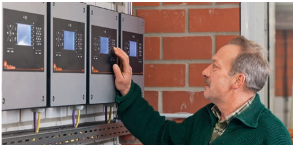
Svaka sortirna vaga TriSort pro se kontrolira preko kontrolne jedinice, u ovom slučaju ugrađene u sobi za servis