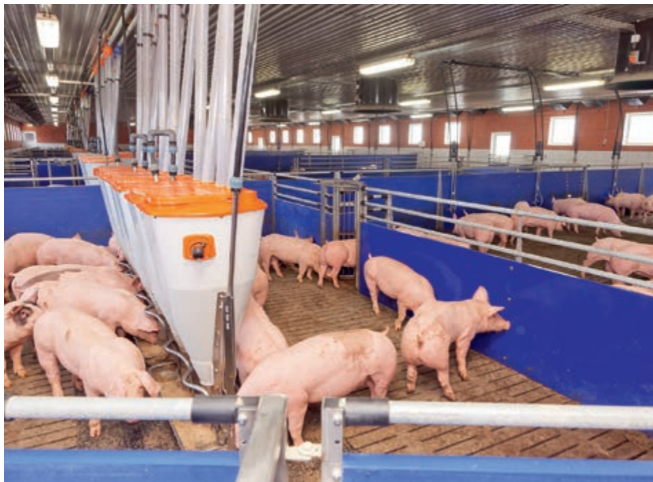
Svinje napuštaju područje hranjenja kroz jednosmjerna vrata nakon hranjenja