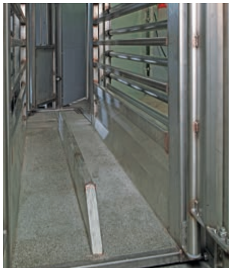
Vaga je opremljena sa neklizajućim podom