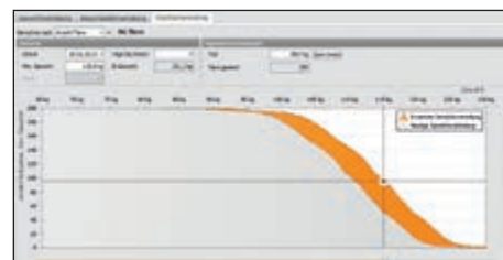
Grafički prikaz procjene povećanja težine