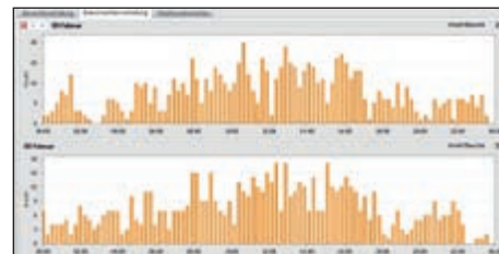
Grafički prikaz frekvencije posjete vagi