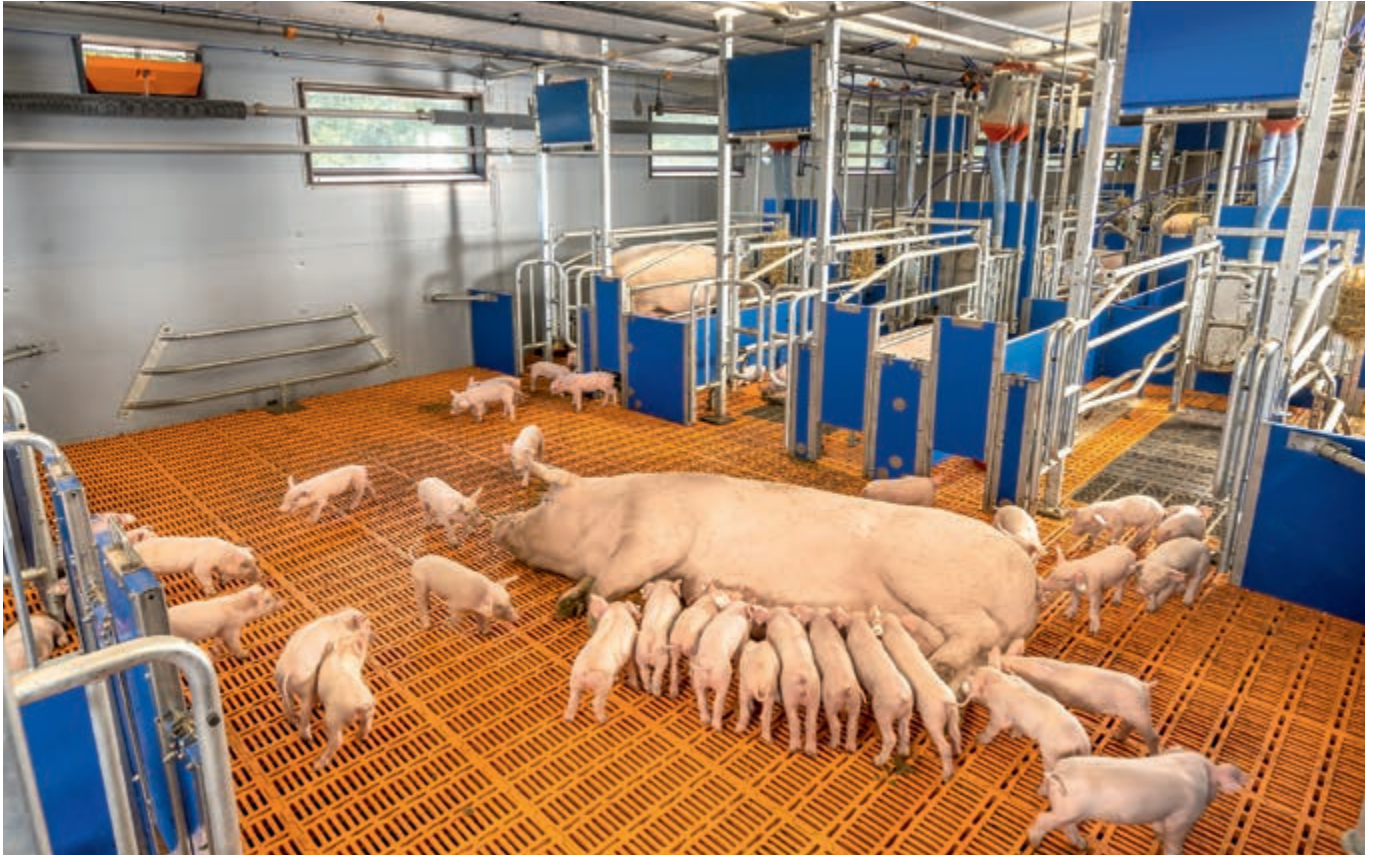
Agilo FB: Manejo en grupo de cerdas con lechones, con gran zona común de movimiento

movimiento, son idénticos a los de Agilo HL. Los lechones también acceden a la zona común de movimiento al través de sus propias aperturas, puertas de lechones.