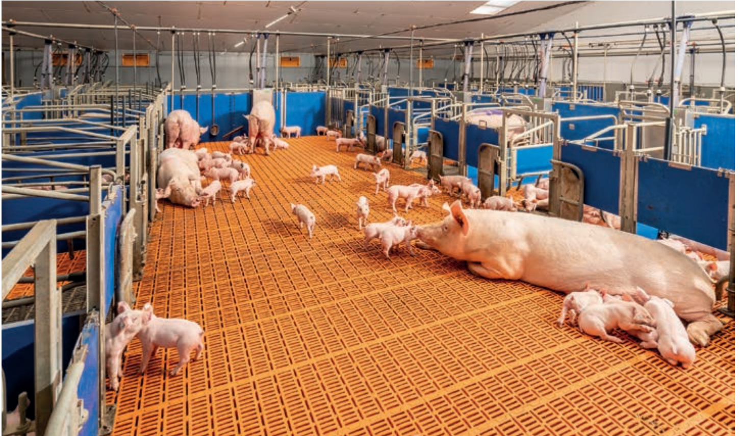
Agilo HL: Manejo en grupo de cerdas con lechones, con gran zona común de movimiento

movimiento al través de sus propias aperturas, puertas de lechones. Allí pueden instalarse más bebederos, comederos automáticos y materiales de entretenimiento, o también una zona de destete separada.