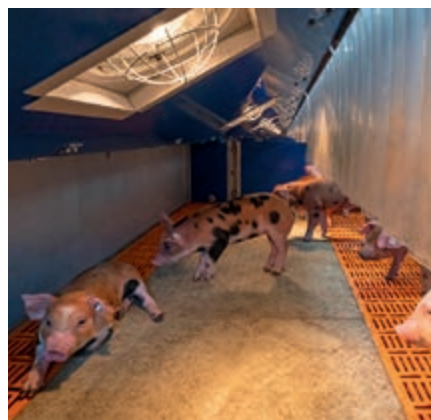
Placas calefactadas y lámparas de calor aportan un ambiente de bienestar en los nidos para lechones