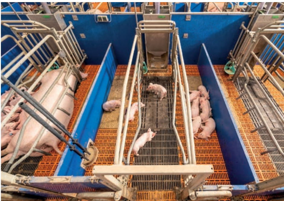
Sistemas de suelo: rejillas plásticas con placas calefacción para lechones y rejillas fundición refrescantes para cerda