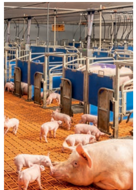
Los lechones tienen sus propias puertas de lechones