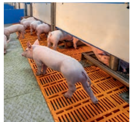
Para inspeccionar, las amplias secciones de paso pueden abrirse y cerrarse manualmente