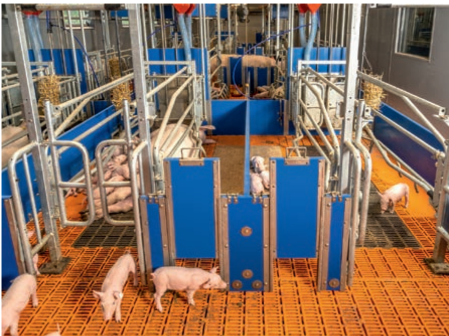
La cerda decide si se queda tumbada, protegida por el bastidor salvalechones, o permanece en la zona común de movimiento