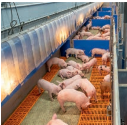
Para controlar, las cubiertas de nidos para lechones pueden abrirse y cerrarse automáticamente con un botón

cortos de espacios de alimentación permiten a las cerdas una tranquila ingesta de pienso. También los lechones tienen acceso al comedero de la cerda y así aprenden de forma natural a ingerir pienso seco.