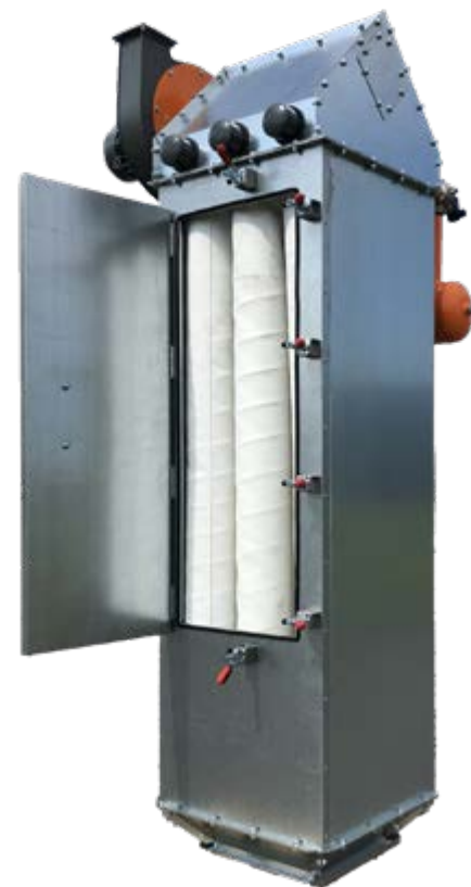
DustBuster XXL V

entstehen, effektiv ab. Die Filtertaschen bestehen aus einem beschichteten Glasfaserkunststoff, bieten einen maximalen Luftdurchsatz und sammeln die Staubpartikel im Filter. Unsere Filtersysteme sind in vielen Größen verfügbar und können für jede Mahlanlage angepasst werden.