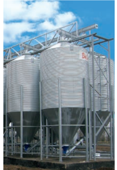
Außensilos zur Lagerung der Rohkomponenten