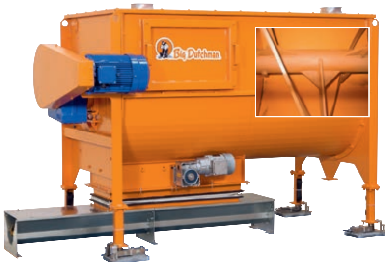
Horizontalmischer mit doppelter, entgegengesetzt rotierender Schnecke