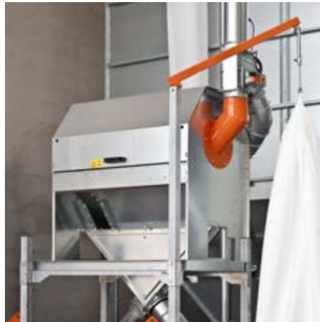
Trommelreiniger T1 als Teil einer Mahlanlage

Der Trommelreiniger T1 besteht aus einem Zulauf für das ungereinigte Getreide, zwei Ausläufen für Sand und größere Partikel sowie einem Auslauf für das gereinigte Getreide. Der Trommelreiniger ist einfach aufgebaut und reinigt Getreide sehr effektiv. Er verfügt außerdem über ein äußeres Sieb für die Sandreinigung und ein inneres Sieb, das größere Partikel abscheidet.