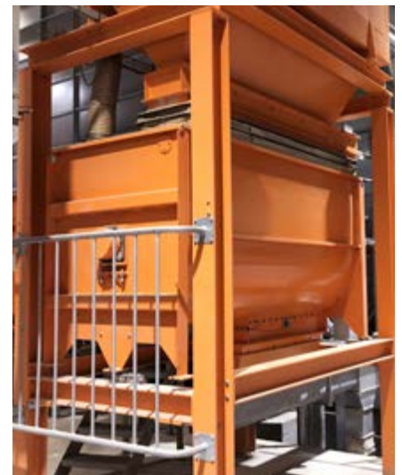
Horizontalmischer mit Vorbehälter

Der Diagonalmischer besteht aus strapazierfähigen Aluminium-Zink-Platten und hat ein Fassungsvermögen bis zu 2000 l. In Verbindung mit einem elektronischen Wiegesystem werden der Zulauf und die Menge der Rohkomponenten gesteuert und so die Futtermischung optimiert. Der Diagonalmischer kann manuell durch eine Öffnung befüllt werden.