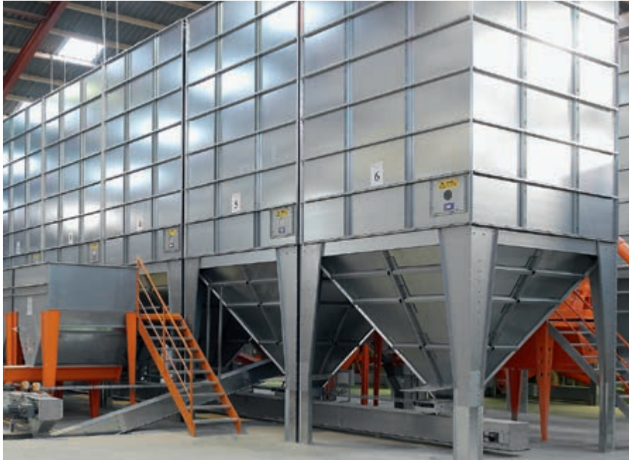
Innensilos zur Lagerung der fertigen Futtermischung

Erfordernissen geplant. Für schwer fließende Komponenten kommen spezielle Schneckensilos zum Einsatz.