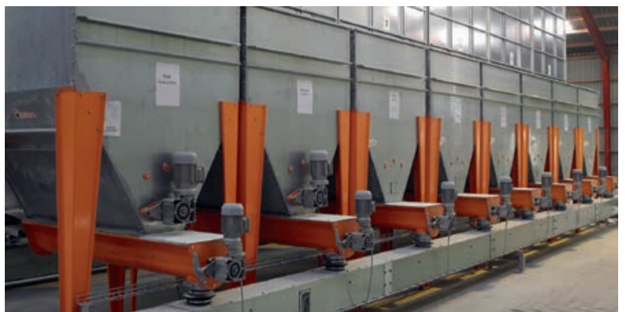
Behälter für Mineralstoffe bis zu jeweils 2 t