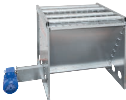
Behälter für Mineralstoffe im Bigbag

Schnecken (Durchmesser 102 mm) oder Spiralen (Durchmesser 75 mm) eingesetzt werden. Bei dem Behälter mit Rührwerk kommen ausschließlich Schnecken (Durchmesser 102 mm) zum Einsatz.