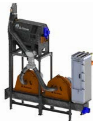
Doppelmühle mit Trommelreiniger T1 und Filter DustBuster XXL

Fördermenge wird automatisch an das jeweilige Fördergut angepasst. Welcher Mühlentyp zum Einsatz kommt (Einzel-, Doppel- oder Parallelmühle), hängt von der notwendigen Leistung ab. Der Transport des fertigen Mehls kann mit verschiedenen Förderelementen (Becher- und Kettenelevatoren oder Trogschnecken) erfolgen.