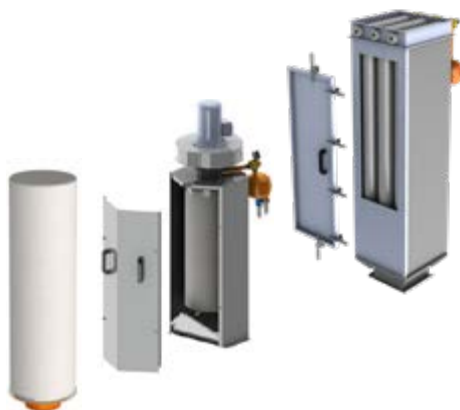
Von links nach rechts: Staubfilter 30/80, DustBuster Easy und DustBuster XXL P