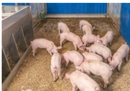
Souvislá pevná podlaha s podestýlkou: ideální pro rytí

Další organický materiál pro zaměstnání zvířat může být nabízen například prostřednictvím jeslí na seno. Koncept welfare zvířat ve stáji Havito® dokonale vyhovuje přirozeným potřebám prasat, jako je odpočinek, žraní, rytí, kálení a močení.