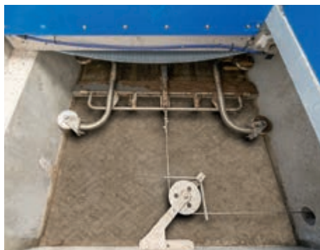
Odklíz hnoje pomocí shrnovacích lopat