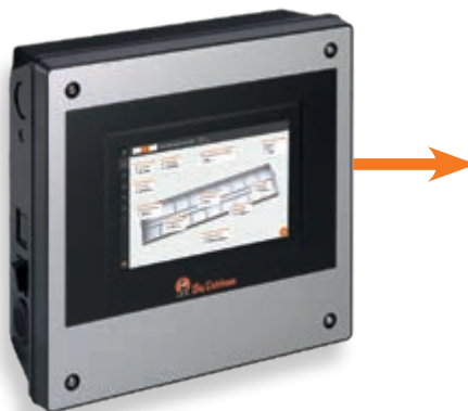
Klimatizační počítač 310 pro

Klima ve stáji je řízeno naším klima-počítačem 307 pro nebo 310 pro .