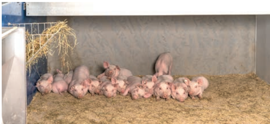
Zakrytí vytváří příjemnou teplotu v prostoru pro odpočinek

Další organický materiál pro zaměstnání zvířat může být nabízen například prostřednictvím jeslí na seno. Koncept welfare zvířat ve stáji Havito® dokonale vyhovuje přirozeným potřebám prasat, jako je odpočinek, žraní, rytí, kálení a močení.