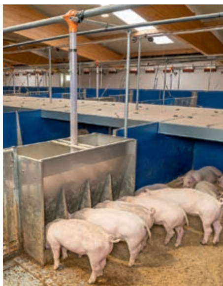
Adlibitní automat na suché krmivo MultiMax

Krmné automaty zásobují prasata suchým krmivem. Náš osvědčený a účinný dopravní systém DryRapid DR 1500 dopravuje suché krmivo, které je dodáváno ve formě šrotu, drti nebo pelet. Další možností krmení je náš počítačem řízený systém DryExact pro . Objemové krmivo lze také snadno rozházet na souvislou pevnou podlahu. Kolíkové napáječky a napájecí misky v různých výškách zajišťují, že prasata mají kdykoliv přístup k dostatečnému množství vody. Aby pevná podlaha zůstala suchá, měly by být napáječky instalovány v blízkosti PigT. Nadbytečná voda pak může odtékat do zachytné vany na moč.