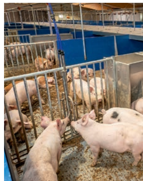
Kolíkové napáječky nainstalované nad PigT