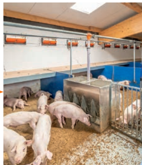
Čerstvý vzduch vstupuje do stáje rovnoměrně: žádný průvan