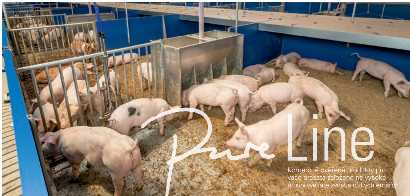
Stáj Havito®: systém „od odstavu do výkrmu“ bez kejdivých kanálů nebo roštové podlahy

Havito® bylo vyvinuto díky úzké spolupráci mezi společnostmi Big Dutchman a výrobcem krmiv Bröring. Nechte si od našich odborníků komplexně poradit s tímto i dalšími koncepty ustájení z naší produktové řady PureLine.