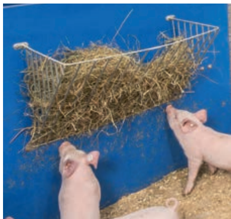
Jesle na seno jako výdej objemového krmiva