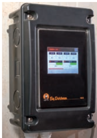
Cellule de contrôle autonome 103