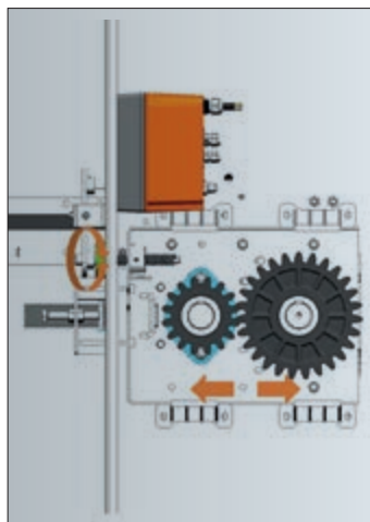
L'unité de réglage est spécialement conçue pour un fonctionnement optimal du tapis à fientes