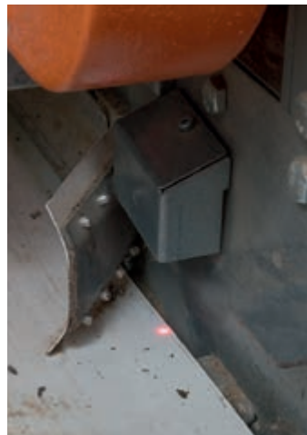
Sensor luminoso para observación del funcionamiento de las cintas