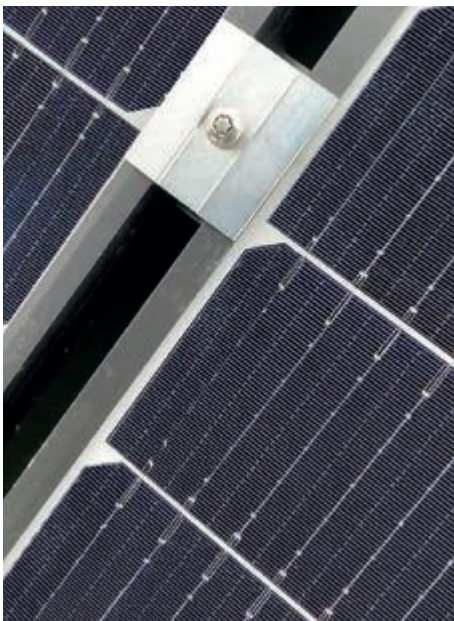
Einsatz hochwertiger Solarmodule mit Diebstahlsicherung

Eine umweltfreundliche, CO 2 -Emissionen sparende und artgerechte Legehennenhaltung ist damit möglich.