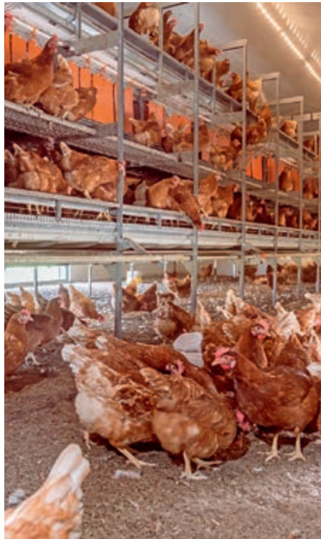
Die gesamte Stallgrundfläche wird als Scharrraum genutzt

Unsere bewährte Voliere NATURA Step ist die Grundlage für eine erfolgreiche und tierwohl-gerechte Legehennenhaltung. Deshalb ist sie auch in unseren Mobilställen verbaut.