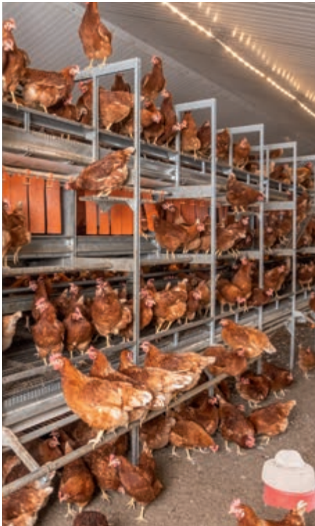
Voliere NATURA Step