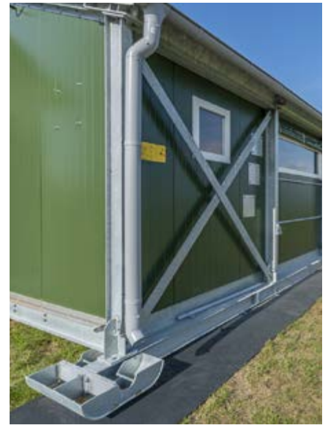
Einsatz von Stahlkufen für den Standortwechsel