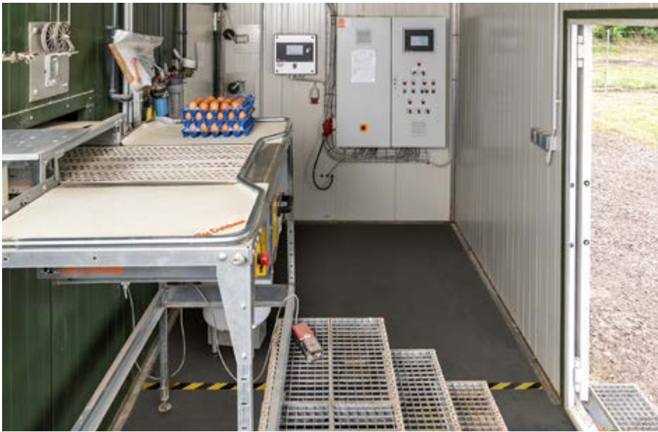
Geräumiger Vorraum zur Eiersammlung