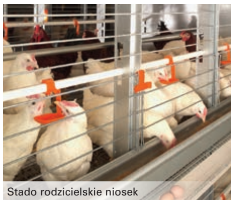
Stado rodzicielskie niosek