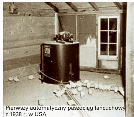
Pierwszy automatyczny paszociąg łańcuchowy z 1938 r. w USA

Łańcuch paszowy CHAMPION firmy Big Dutchman ma uniwersalne zastosowanie, w systemach klatkowych, do chowu stad rodzicielskich niosek, młodych kurek od pierwszego dnia i kur niosek, w chowie podłogowym stad rodzicielskich brojlerów oraz oczywiście w alternatywnym chowie niosek.