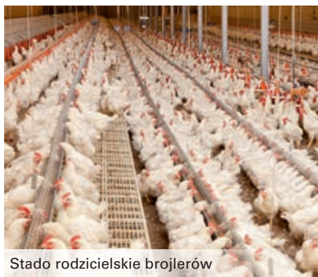
Stado rodzicielskie brojlerów