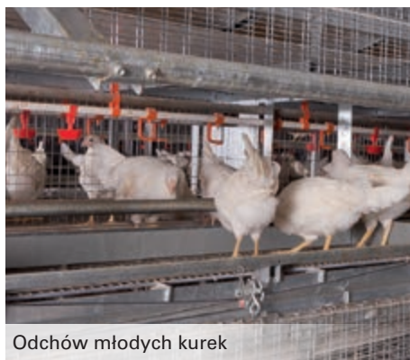
Odchów młodych kurek