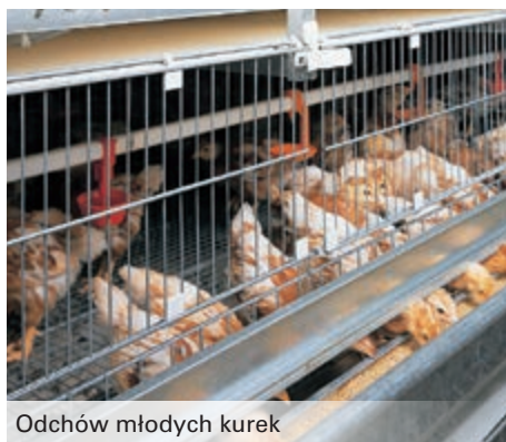
Odchów młodych kurek