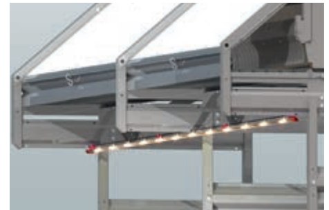
FlexLED sorgt für gute Ausleuchtung unter dem Nest