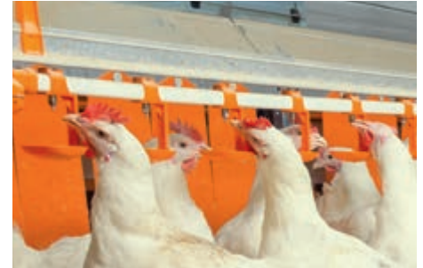
Nippeltränke vor dem Nest